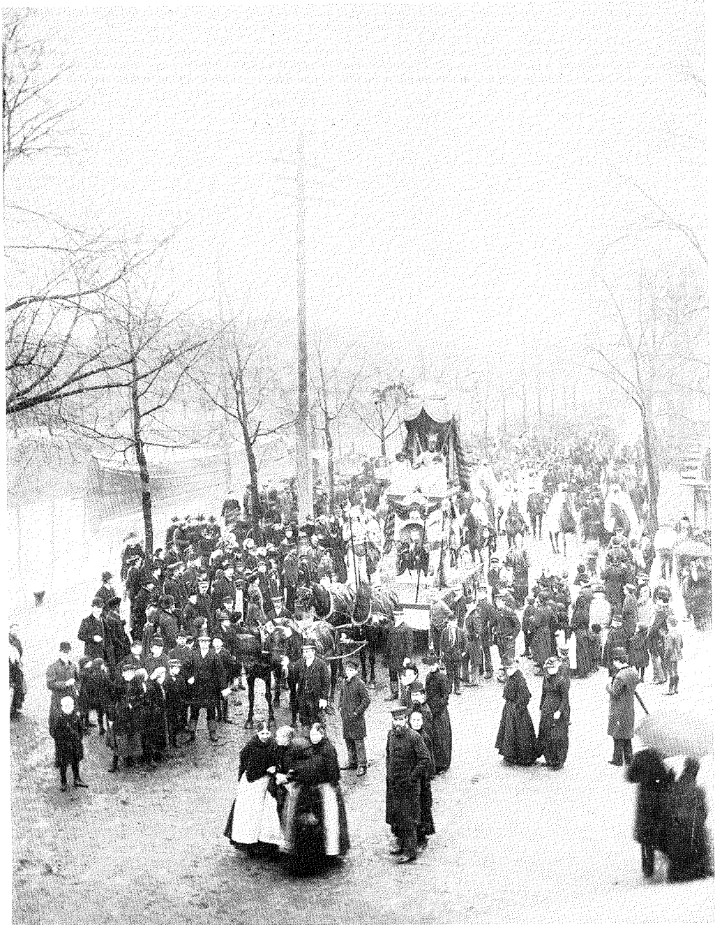
Optocht van de Oeteldonksche Club in 1894. Op de praalwagen is gezeten Z.K.H. Ching Chang Chung, keizer van China, omgeven door bedienden en soldaten.