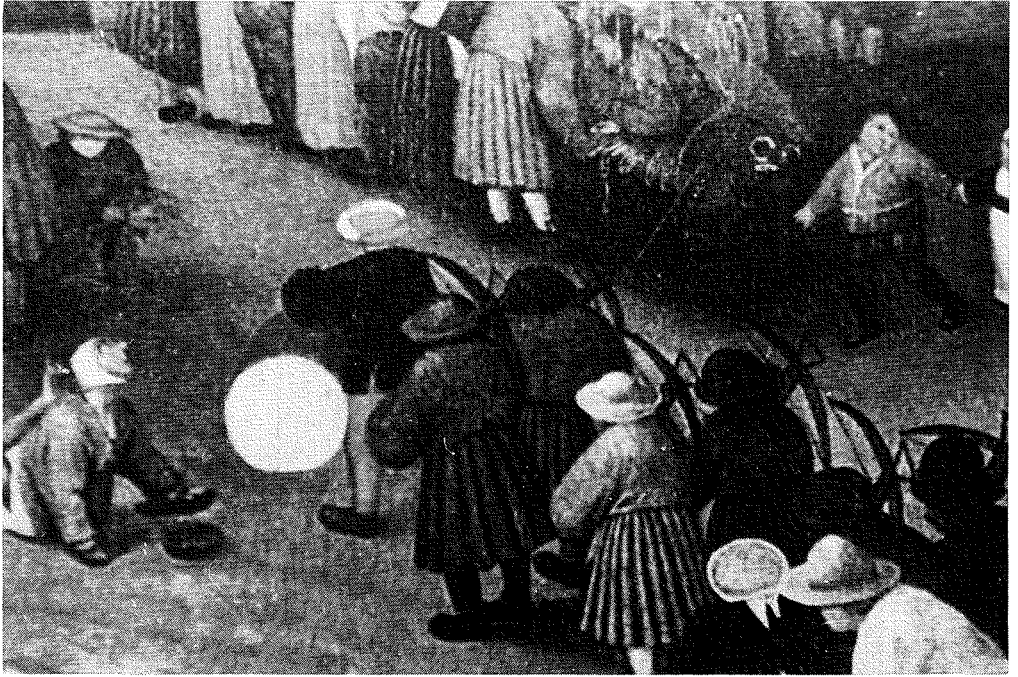
Abbeelding 3. Detail uit de boerenkermis van Pieter Brueghel de Jonge.

'Item op den kermis zullen ook alle gildebroeders smorgens ten 8 uren vergaderen met hunne wapenen ter plaatse door de dekenen geordonneert zijnde in orde te trekken samen naar de hoogmisse om cierlijk en met alle eerbiediging tot lof des Hoogwaardigen Heiligen Sacrament en ter eeren van de Heilige maget Catharina de processie te volgen...'