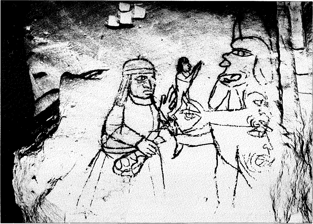
Tekening in rood krijt op kalksteen in mergelgroeve van Sint-Pietersberg-complex. Stelt vrouw (?) voor die haar ziel aan de duivel verkoopt (tweede helft zestiende eeuw). 80 × 60 cm.

hoogte ook geldt voor de Criminele Ordonnantien van Philips II (1570). Beide wetboeken behelsden beperkende bepalingen over de toepassing van de tortuur. Lyna merkt op, dat in de Loonse heksenprocessen vóór 1600 aan de tortuur geen enkele limiet werd gesteld. Zes of meer pijnigingen achter elkaar zijn bekend. Soms stierf het slachtoffer onder de handen van de beul. In Tongeren werd een vrouw gedurende twaalf uur (!) aan de ladder gehangen. Elders werden hoogbejaarden wel enigszins ontzien of was de beul onwillig foltering toe te passen. Lijn Jehaes bleef in juli 1668 ontkennen tijdens de pijniging. Tenslotte staakte de beul het hangen aan de ladder uit compassie met de tachtigjarige, 'vresende dat die selve onder zijn handen zou sterven' 22 .