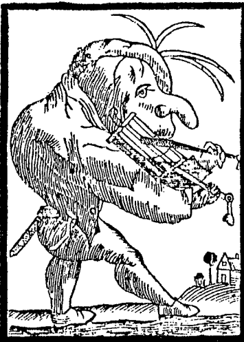
Ik speel op de rooster.

Opmerkelijk is dat alle gevallen waarin wel door de overheid werd opgetreden, te plaatsen zijn na het beruchte incident met Jan van Es in Oss. Aan de hand van een charivari uit 1771 te Veghel geeft Jacobs een uiteenzetting over de gerechtelijke procedures en pogingen om deze zaak te juridiseren. Mede gezien de strafmaat die in deze zaak werd toegepast lijkt het erop dat juristen en schepenen het volksgericht meer zagen als een vorm van baldadigheid in plaats van een ernstig crimineel feit. De netelige tussenpositie van de lokale overheidsdienaren, die enerzijds loyaliteitsbanden hadden als mede-ingezetenen van de plaats waar het volksgericht zich had voltrokken, maar anderzijds tevens vertegenwoordigers waren van de centrale overheid, is ten dele bepalend geweest voor het juridisch vervolgingsbeleid. In veel gevallen hebben schout en schepenen hun loyaliteit met de bevolking zwaarder laten wegen en de gebeurtenissen stilzwijgend door de vingers gezien. Er zijn zelfs gevallen bekend waarbij de lokale vertegenwoordigers van de overheid zelf actief deelnamen aan charivari's 32 . Als culturele tussenpersonen laveerden zij, evenals de geestelijkheid, tussen twee werelden en selecteerden daarbij elementen uit hun gedragsrepertoires al naar gelang de situatie vereiste 33 .