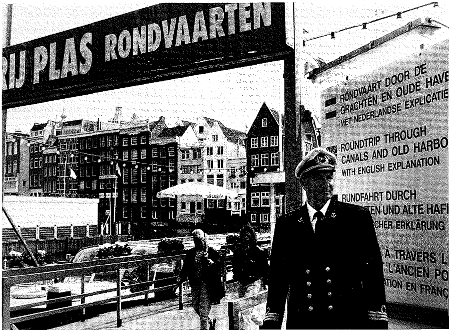
Rederij Plas aan het Damrak, mei 1993.

rikaanse, Japanse, Franse en Italiaanse stellen, en een paar groepjes die een voor mij onbegrijpelijke 'exotische' taal spreken. Met uitzondering van de kapitein is er geen personeel aan boord. Er is slechts een jongen die limonade en snoep verkoopt en die de boot voor het vertrek weer verlaat. Terwijl de boot zich richting haven in beweging zet, worden de passagiers door een vrouwestem uit de luidspreker in vier talen welkom geheten. De stem is afkomstig van een bandje dat gedurende de rondvaart afgedraaid wordt en in het Nederlands, Engels, Frans en Italiaans (in