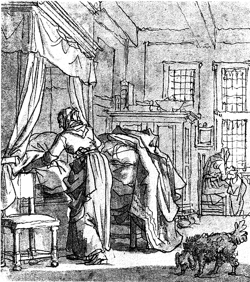
Afb. 1. Jan Luyken (1649-1712), 'Het bed'. Ongesigneerde en ongedateerde tekening (pen in bruin, penseel in grijs gewassen), voorstudie voor de gelijknamige gravure in Luykens Het leerzaam huisraad (1711).