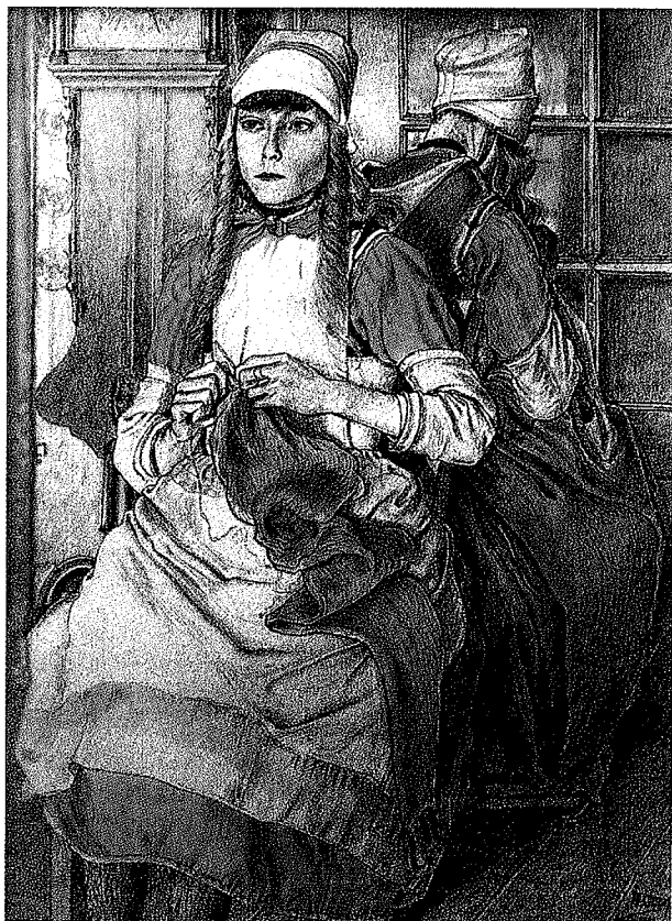
◀ Toerisme en schilderkunst ineen: een prentbriefkaart naar Jan Toorops Marker breistertjes .

Rudolf Virchow, Beiträge zur physischen Anthropologie der Deutschen, mit besonderer Berücksichtigung der Friesen (Berlijn 1877).