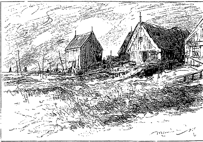
◀ 'Maisons de pêcheurs à Marken'. Uit: M. Heins en A. Heins, En Hollande (Brussel z.j.).

ment nog niet in een tijdvak van meer dan vijftigduizend jaar geleden werden gesitueerd. 25