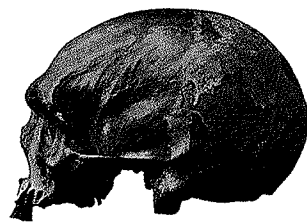
▲ De 'Batavus genuinus'. Uit: J.A.J. Barge, Friesche en Marker schedels. Bijdrage tot de kennis van de antropologie der bevolking van Nederland (Amsterdam 1912) (Universiteitsbibliotheek Amsterdam).